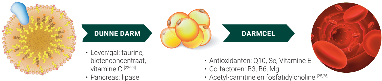
Figuur 2. Vereenvoudigde weergave vetresorptie.

Het spijsverteringsproces is te vergelijken met radertjes die feilloos en op het juiste tijdstip op elkaar aanhaken: goed kauwen instrueert de maag, voldoende maagzuursecretie zet galblaas en pancreas aan tot secretie. In onderstaande figuur wordt de lipidenabsorptie vereenvoudigd weergegeven. Galzouten en enzymen verkleinen de vetdeeltjes tot opneembare grootte. Antioxidanten beschermen de essentiële vetzuren tegen oxidatie tijdens hun transport in de bloedbaan. Acetyl-carnitine, fosfatidylcholine en diverse cofactoren ondersteunen de vetzuurstofwisseling en het vetzuurtransport doorheen de celmembranen.